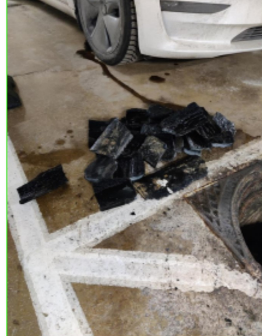
JV-linjan kova aines