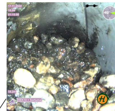
18,2m - Putkirikko, kiviaines pääsee putkilinjaan, VL4.