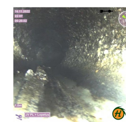
1,1m - Putken seinämässä kovettunutta kertymää, VL2.