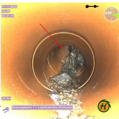
24,3m - Epäily putkirikko, putkilinjaan pääsee kivi-ainesta, VL4.